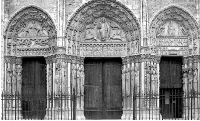
Foto 6. Portalul Regal, faada catedralei din Chartres, Frana (șantierul școală al sculpturii gotice), apud. W. Gardner.