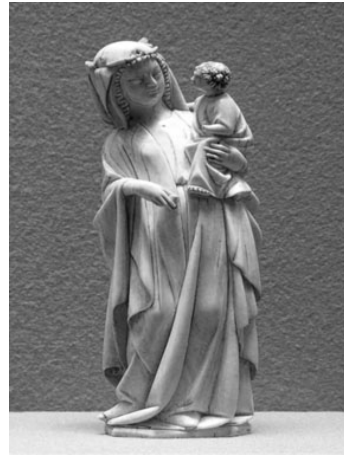
Foto 5. Canonul iconografic gotic: contrapost, naturalism, debutul formelor serpentine, apud W. Gardner .