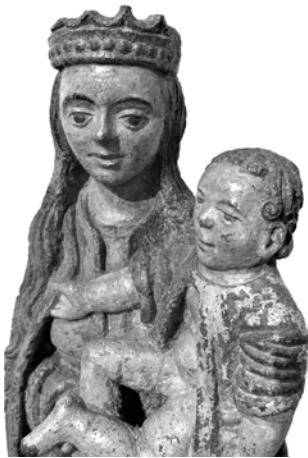
Foto 4. Canonul romanice al sculpturii: imobilism, frontalitate, disproporție anatomică, apud W. Gardner

Viața formelor descătuseate sau reglate de canoane reprezintă un subiect inepuizabil de cercetare din perspectiva istoricului de artă. Exemplele furnizate oferă o incursiune în această lume fizică normată diferit a cărei unitate stilistică a fost subliniată prin evidențierea diversității.