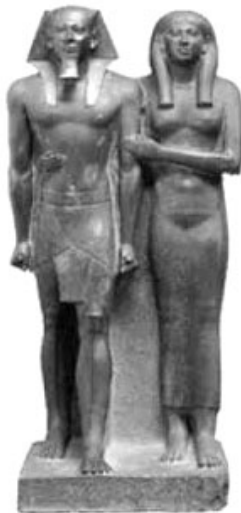
Foto 1. Faraonul Mikerinos și soția, ilustrare a canonului iconografic egiptean: stereotipie, imobilism, lipsă expresivitate, raport 2 X 10 X 6, apud W.Gardner .

Tendența naturalistă în arta occidentală este o continuatoare a celei orientale, aceasta modelând exprimările formale și ilustrând un conținut eclectic de motive și modele. Creațiile naturii sunt cel mai bine imitate în sculptură, prin folosirea rațională a celor trei dimensiuni. Trei dimensiuni stereotipe în arta plastică egipteană, canon iconografic unitar ce se referă la imobilismul figurilor, absența expresivității și pasul către moarte schițat de cei reprezentați.