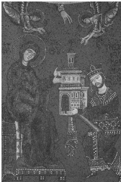
Fig. 11. Regele Wilhelm II (1166-89) donează catedrala Fecioarei Maria. Mozaic, 1176. Domul din Monreale, Palermo.