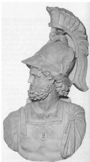
Fig. 5. Mars Ultor , prima parte sec. II d.Ch. (copie). Templul augustean al lui Mars Ultor , Roma.