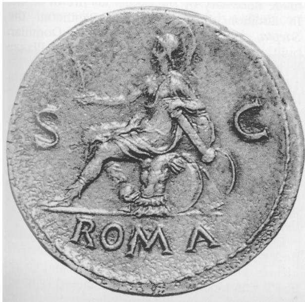
Fig. 8. Alegoria Romei. Monedă (verso) din timpul domniei lui Nero (54-68 d.Ch.). Monetăria Romei.