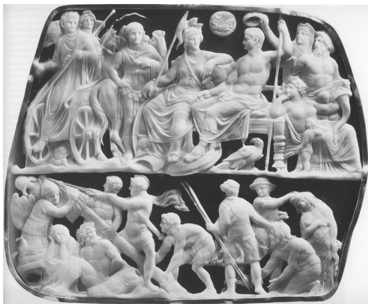
Fig. 3. Gemma Augustea , 10 d.Ch. (18,7 x 22,3 cm). Muzeul de istorie a artei, Viena.