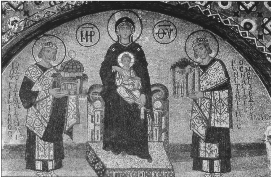
Fig. 10. Iustinian I (stânga) și Constantin I (dreapta), închinând Fecioarei cu pruncul, primul, Hagia Sophia, și al doilea, cetatea Constantinopolului. Mozaic, 990. Galeria de Sud. Hagia Sophia, Istanbul.