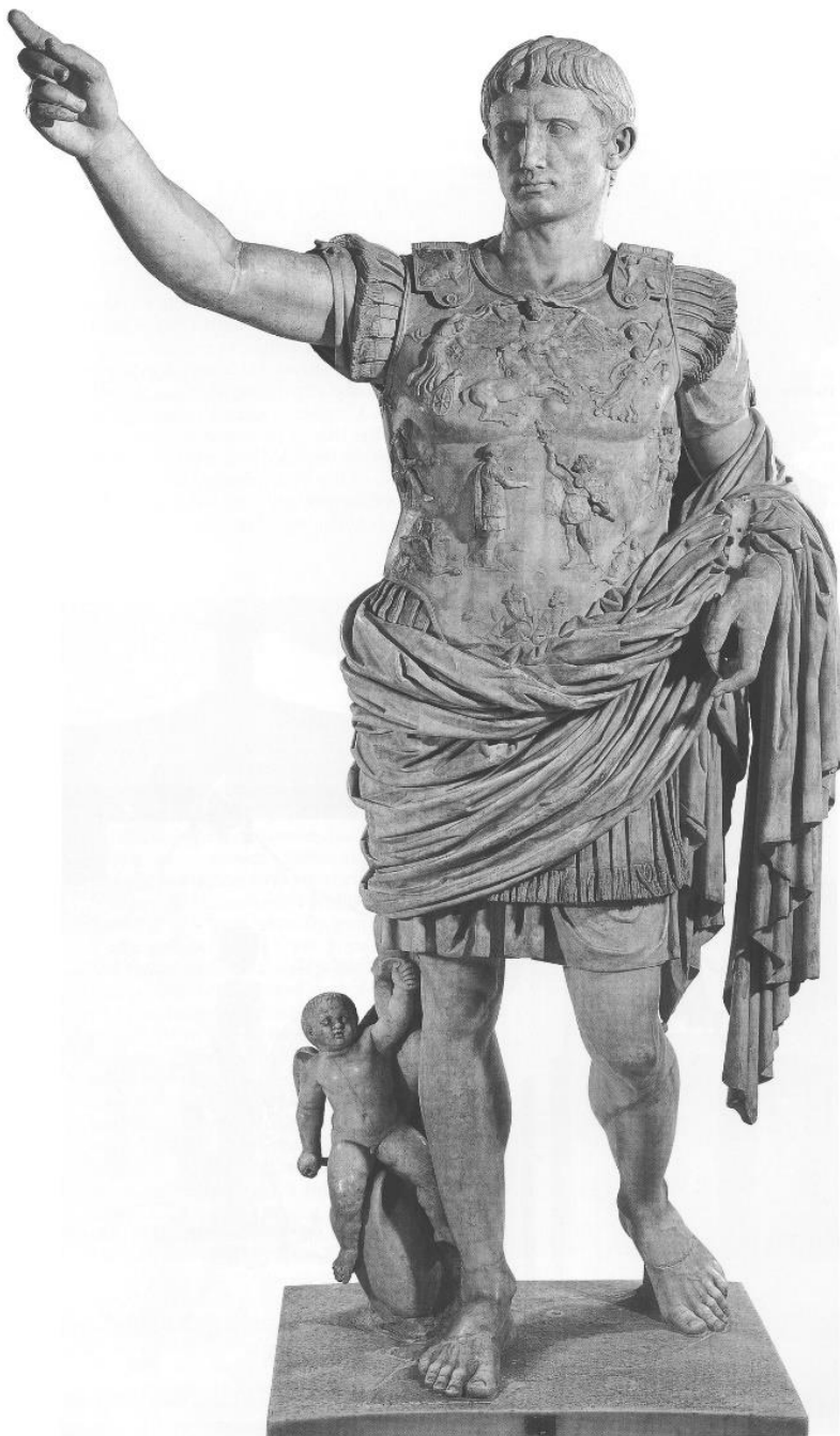
Fig. 7. Augustus (27 i.Ch-14 d.Ch.). Muzeul Vatican, Roma.