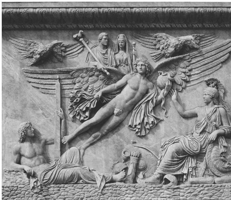
Fig. 4. Columna lui Antoninus Pius (161 d.Ch.). Relief de pe piedestal. Muzeul Vatican, Roma.