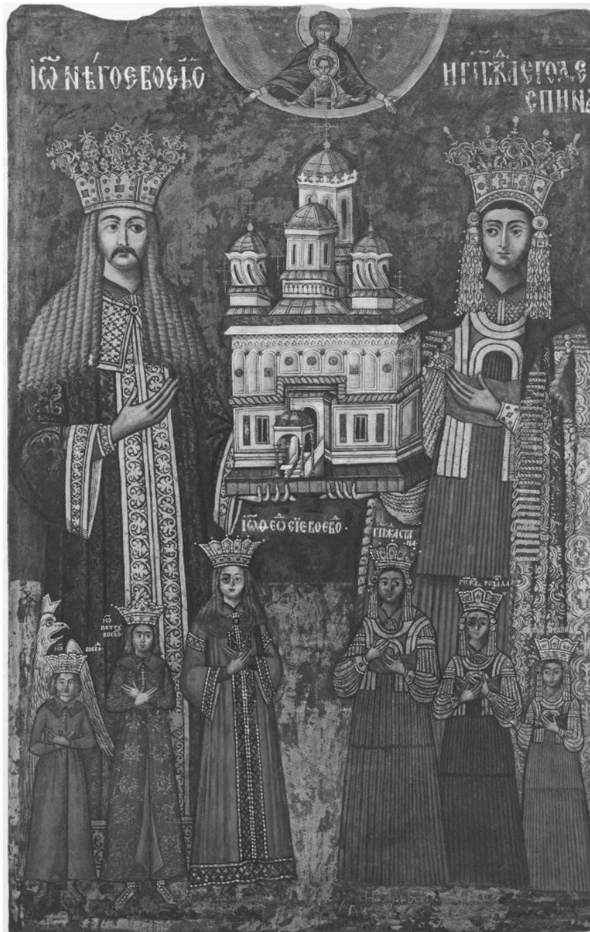
Fig. 12. Tabloul votiv al lui Neagoe Basarab (1512-21), al doamnei Despina Mihaela (1512-21) și al copiilor lor. Frescă, înainte de 1526. Meșterul Dobromir. Mănăstirea Curtea de Argeș, Argeș.