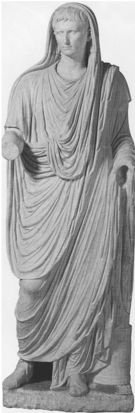
Fig. 6. Augustus, ca Pontifex Maximus (27 î.Ch-14 d.Ch.). Palatul Massimo alle Terme. Muzeul Național Roman, Roma.