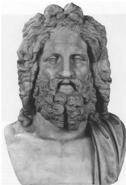
Fig. 2. Jupiter Otricoli (replică a statuii de cult Jupiter Capitolinul), prima jumătate sec. I î.Ch. Muzeul Vatican, Roma.