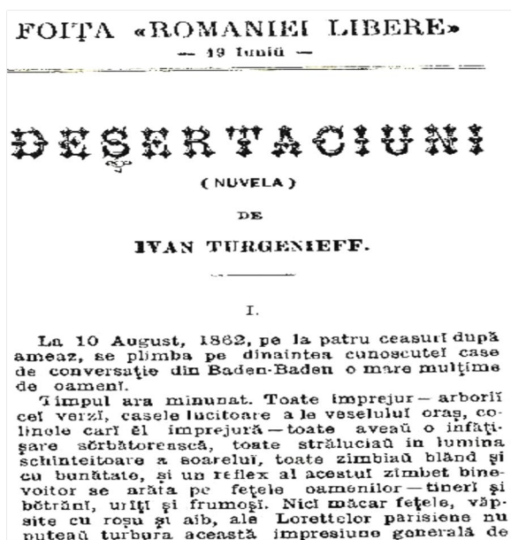
Fig. 3 Fragment de traducere publicată în România liberă , VI, 1882, nr. 1500.