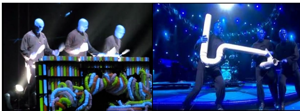
Blue Man Group – imagini din timpul spectacolului din Las Vegas, S.U.A.

Sfârșitul anilor '80 și începutul anilor '90, găsește două grupuri de artiști, care reușesc cu succes să introducă un nou tip de artă scenică, combinând teatrul cu percuția neconvențională, pantomima, decorurile futuriste, sunet, lumini și efecte speciale ale vocii, realizând astfel un sincretism al artelor. Este vorba despre grupurile Blue Man Group din S.U.A și Stomp, din Marea Britanie. Principala diferență acustică dintre cele două grupuri constă în utilizarea de către Blue Man Group a unor instrumente special create de artiștii înșiși, pe când Stomp recurge la transformarea unor obiecte în instrumente de percuție. Bineînțeles și tipul de spectacol realizat de cele două grupuri prezintă diferențe.