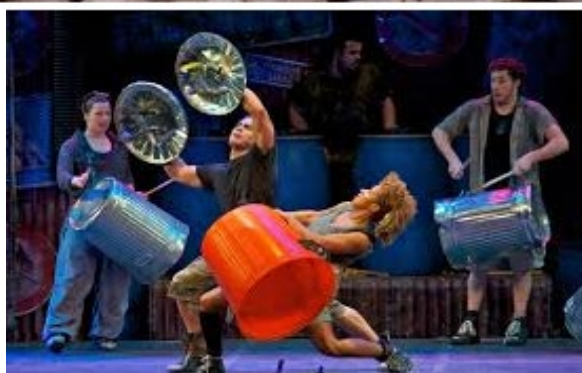
Stomp – imagini din spectacol, Las Vegas, S.U.A.

Grupul Sistem a reușit cu brio fuziunea între convențional și neconvențional prin îmbinarea elementelor de ritmică tradițională europeană, cu cele aparținând altor culturi, în speță sud-americane, africane sau asiatice, folosind instrumente de percuție din ambele sfere (setul de multipercuție, recipiente din metal, mase plastice, lemn, precum și unelte folosite în construcții, de pildă polizorul unghiular). De asemenea, grupul a promovat tipul de artă scenică propusă de predecesorii Stomp sau Blue Man Group , definind conceptul de actor-percuționist, un artist complet, pregătit pentru un altfel de spectacol, deosebit de admirat de public.