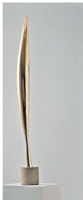
Fig. 4 Constantin Brâncuși, Pasăre în spațiu , 1928