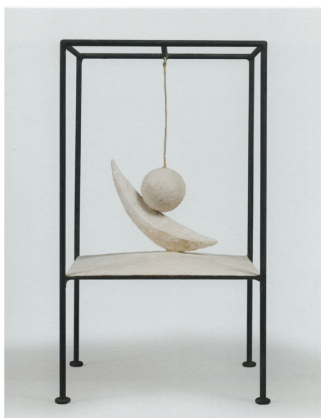
Fig. 8 Alberto Giacometti, Bilă suspendată , 1930-1931