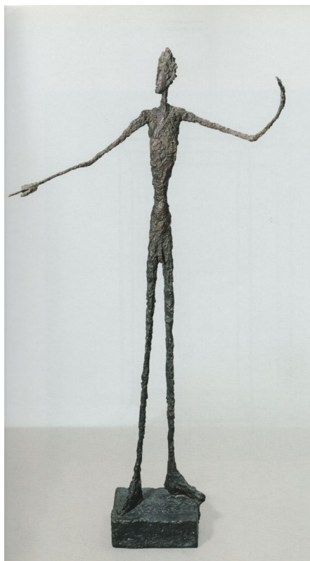
Fig. 13 Alberto Giacometti, Bărbat indicând ceva , 1947