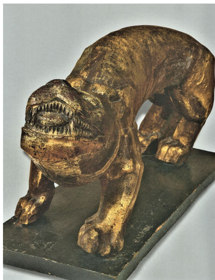
Fig. 2 Ossip Zadkine, Fiară sau Tigru , 1920-1921