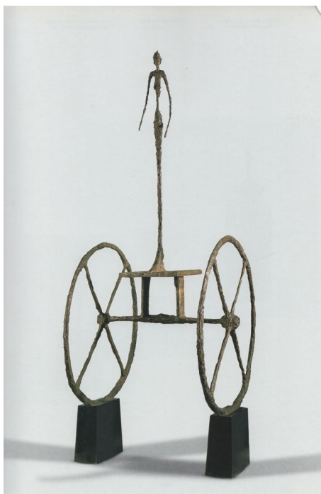
Fig. 12 Alberto Giacometti, Car , 1950