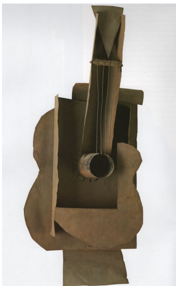
Fig. 1 Pablo Picasso, Chitară , 1912