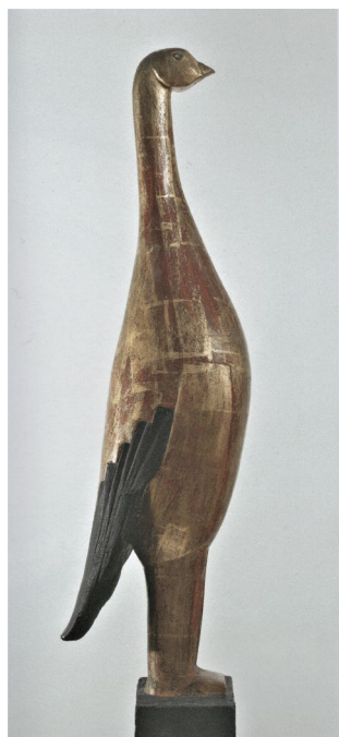
Fig. 3 Ossip Zadkine, Pasăre de aur , 1924