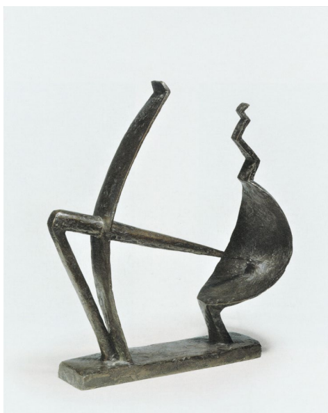
Fig. 7 Alberto Giacometti, Bărbat și femeie , 1928-1929