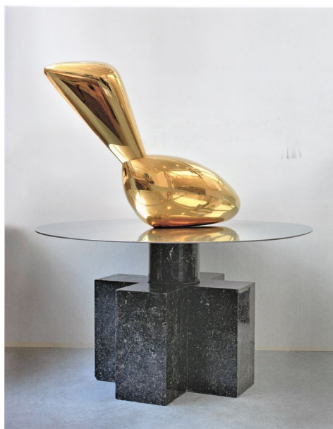
Fig. 14 Constantin Brâncuși, Leda , 1926