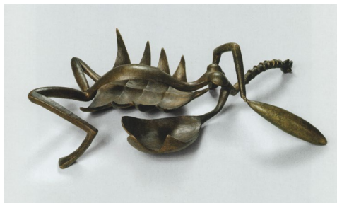
Fig. 10 Alberto Giacometti, Femeie cu gâtul tăiat , 1932