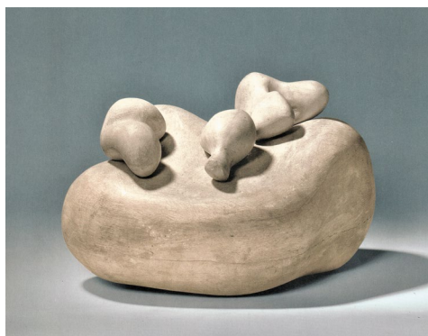
Fig. 6 Jean Arp, Trei obiecte dezagreabile pe o figură , 1930