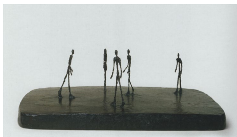
Fig. 11 Alberto Giacometti, Piața , 1948