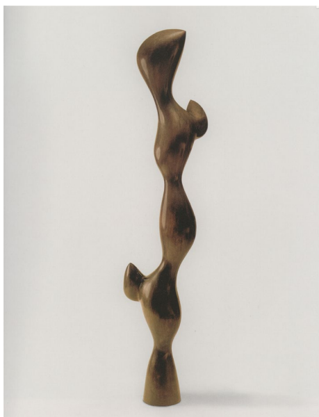
Fig. 5 Jean Arp, Tors cu muguri , 1961