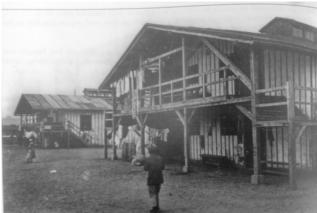
Figura 2. Una baracca nel campo di Wagna.

e i nde iò tignù fermi na di nte na baraca arento la stasion del treno. Poi cu iera na sarta ora de noto ze vignù tanti cari cui manzi che i nde iò fato zì n zora e npo de fameiei i ndò menà per ogni vilagio. A mi mi veva tocà da zì ntele scule a Kemer [Camar, Romania, distretto di Salaj] e là i nde iò tignù dai tre de zugno fina ai dodize de otobre, perché iera meso n guera la Rumenia n contro l Austria. E cusì anca sta volta i nde iò menà cui cari fina n stasion a Szilasomio che poi na ora prima de noto i nde iò fato zì n treno e i ndo menà fina n Boemia. Per viazo i ndo dà da magnà a Gior [Gyor] n Ungaria e a Praga, poi là i iò destacà i vagoni e noi i ndo menà a Königinhof e altri i li iò menadi sa e là per la Boemia. Cu signemo rivadi n sta cità i ndo meso nten grandando baracon. Là vemo catà anca Tirolesi, fati scanpà anca iei da le so case colpa la guera. Poi allora via de sto baracon i ndo meso per le case dei privati n afito, e a laorà per le fabriche. Poi, ai dodize de genaro 1917 mi sen zì soldà e la zento no ze vignudi a Vale fina i primi mesi del 1918”.