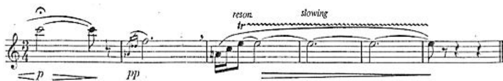
Exemplul nr. 9, finalul lucrării

Lucrarea se încheie cu un tril de rezonanță pe nota Mi în registru mediu cu o durată de aproximativ 9 timpi într-un descrescendo.