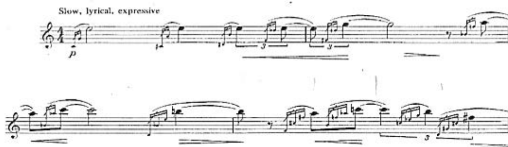
Exemplul nr. 8, introducerea

Din punct de vedere dinamic această lucrare este într-o nuanță foarte mică ajungând la cea mai puternică nuanță pe durata întregii părți la mf , acesta fiind și punctul culminant pe nota Re. Această parte este construită din valori de note mari care sunt ca niște piloni precedați de apogiaturi.