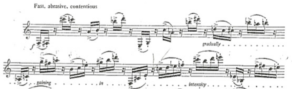
Exemplul nr. 6, secțiunea A

Partea a III-a este creată din două secțiuni: A și B, neavând indicație metrică, măsurile fiind delimitate doar prin pauzele de respirație și cele de caracter. Prima secțiune A începe cu o indicație foarte rapidă care accelerează pe parcurs din măsură în măsură urcând în intensitate. Secțiunea A este formată din grupuri de șaisprezecimi cu accent care sunt despărțite printr-o pauză de șaisprezecime, astfel salturile de șaisprezecime dau impresia de două voci ale clarinetului.