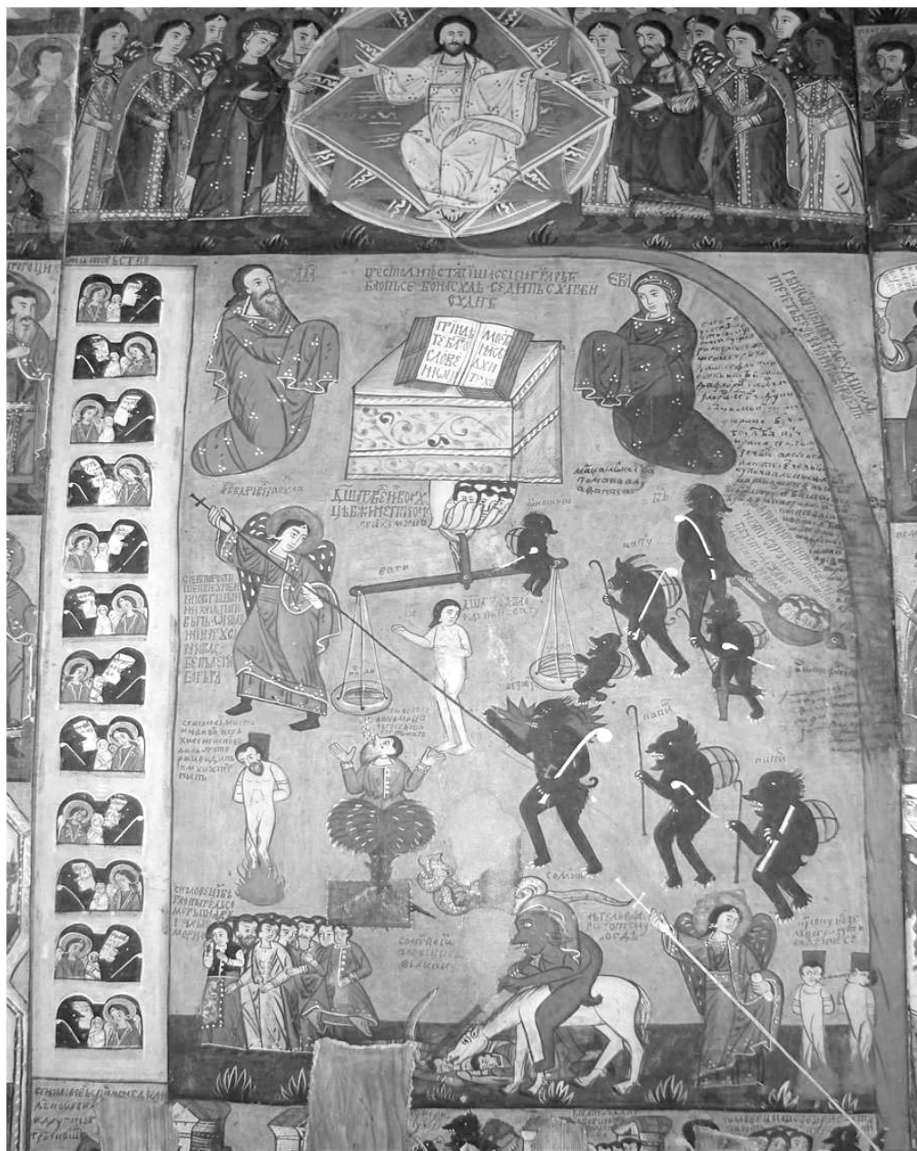
Fig. 2. L'icône du Jugement dernier, peinte a tempera sur bois par Mykhail Popovych de Kolomyia (XVIIe siècle), l'église « Saint Nicolas » de Budești-Josani, département de Maramureș. Photo : Cristina Bogdan