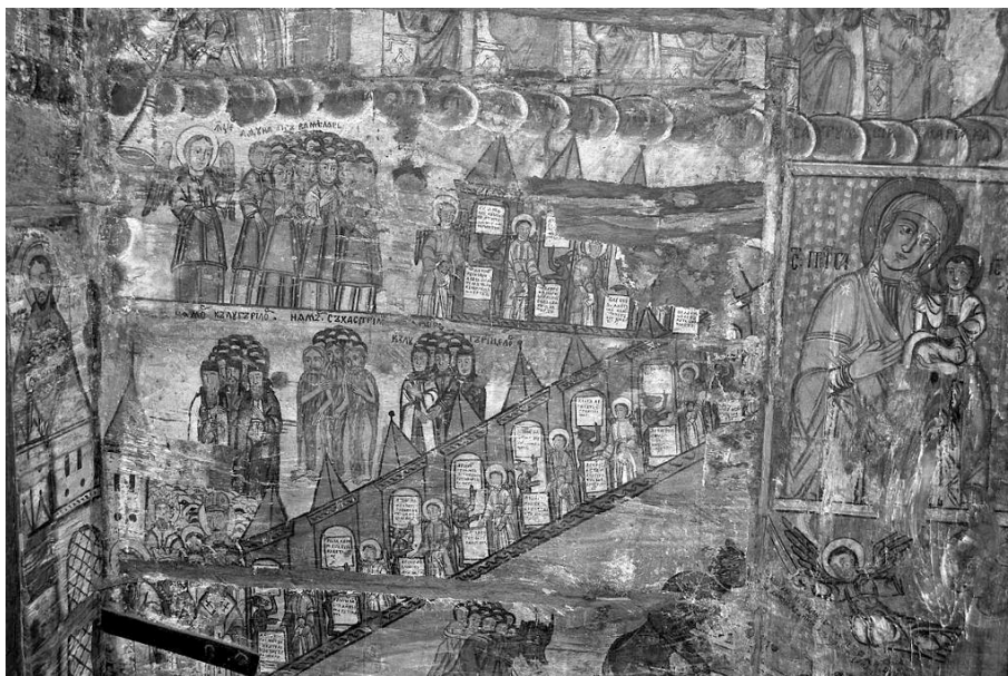
Fig. 5. Le Jugement dernier (fragment) et les Péages aériens, dans le narthex de l'église de la « Nativité de la Vierge » de Călinești-Căieni, département de Maramureș (peinte par Alexandru Ponehalschi, en 1754).