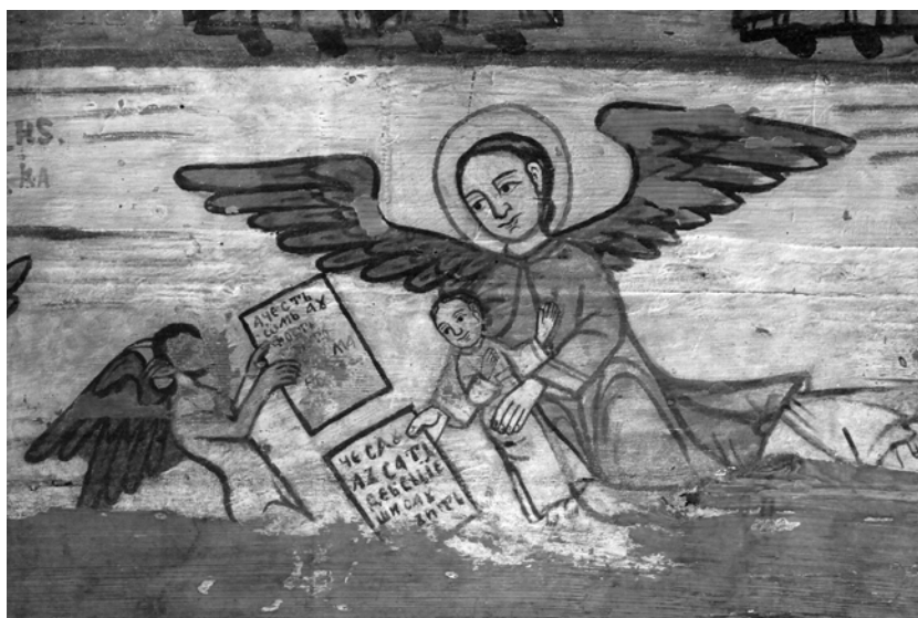
Fig. 4. La confrontation entre le diable-péager et l'ange gardien pour damner ou sauver l'âme du défunt, Ieud-Deal (détail).