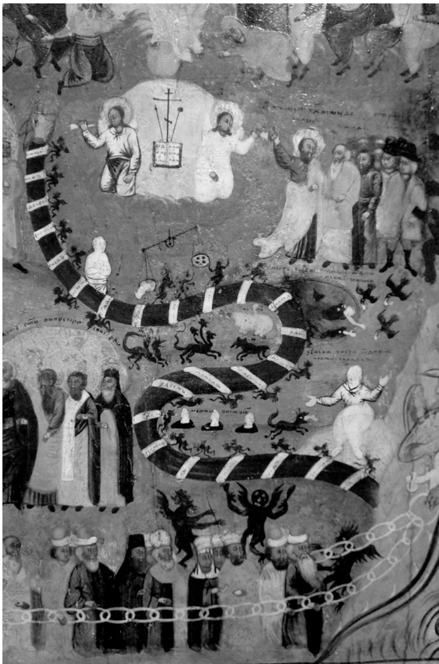
Fig. 1. Le Jugement dernier (fragment) et les Péages aériens, icône russe, Asie Mineure, XVIII e siècle, Collection du Musée Byzantin d'Athènes, BXM 10617.