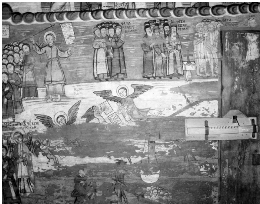
Fig. 3. Le Jugement dernier (fragment) et les Péages aériens, dans le narthex de l'église de la « Nativité de la Vierge » de Ieud-Deal, département de Maramureș (peinte par Alexandru Ponehalschi, en 1765).