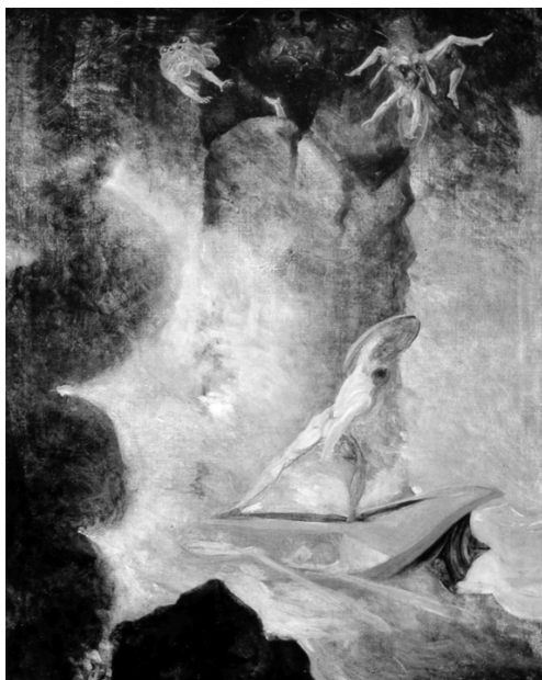
Henry Fuseli, Ulise în fața Scilei și Caribdei , 1794-1796

îndoitului pericol: venit medio vi pontus et undis/ Hesperium Siculo latus abscondit, arvaque et urbes/ Litore diductas angusto interluit aestu./ Dextrum Scylla latus, laevum implacata Charybdis/ Obsidet, atque imo barathri ter gurgite vastos/ Sorbet in abruptum fluctus rursusque sub auras/ Erigit alternos, et sidera verberat unda./ At Scyllam caecis cohibet spelunca latebris/ Ora exsertantem et navis in saxa trahentem./ Prima hominis facies et pulchro pectore virgo/ Pube tenus, postrema immani corpore pistris/ Delphinum caudas utero commissa luporum./ Praestat Trinacrii metas lustrare Pachyni/ Cessantem, longos et circumflectere cursus,/ Quam semel informem vasto vidisse sub antro/ Scyllam et caeruleis canibus resonantia saxa (Aen., III, 417-432) „Dup-aceea marea,/ La mijloc pătrunzând cu-a ei talazuri,/ A despărțit cu sila două țărături/ Și-a dezbinat Sicilia de Hesperia./ De-