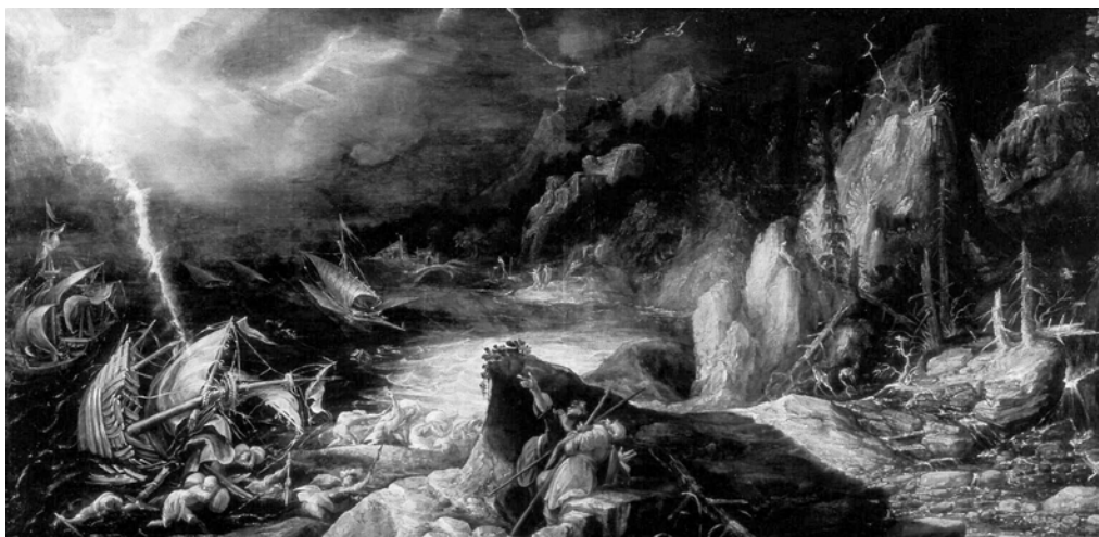
Frederik van Valckenborch, Peisaj cu scene din Eneida vergiliană , 1603

Ithacae, Laertia regna, / Et terram altricem saevi exsecramur Ulixi. / Mox et Leucatae nimbo cacumina montis / Et formidatus nautis aperitur Apollo (Aen., III, 268-275) „Iar noi gonim pe înspumata mare / Pe unde, priincios, ne-ndreaptă vântul / Și Palinur, cârmaciul nostru. Iată, / Din toiul valurilor se ivește / Împădurita insulă Zacintos, / Dulichiu, și Same, și Neritos, / Ostróvul cel cu înălțimi pietroase. / Scăpăm de stâncăriile Itacăi, / De țara lui Laerte, blăstămând-o, / Că ea doar l-a hrănit pe nemilosul / Ulise. Dup-aceea ni s-arată / În neguri, vârful muntelui Leucate / Și templul lui Apolo, cel de care / Se tem corăbierii” (trad. G.I.T., p. 143).